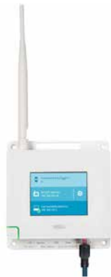
VaiNet AP10 ネットワークアクセスポイント

ヴァイサラ viewLinc モニタリングシステムは、LoRa®* 技術に基づいたヴァイサラ VaiNet ワイヤレスデバイスを使用して、環境条件を無線で追跡します。改良されたチャープスペクトラム拡散 (CSS) * 信号変調を使用して、VaiNetは長距離間でも、また過酷かつ複雑で障害物のある環境下においても、きわめて信頼性が高い安定した通信を提供します。長距離ワイヤレス通信は信号の強度を回復させるリピーターの必要性をなくします。VaiNetのワイヤレスデータロガーとアクセスポイントは事前にプログラムされており、相互を確認し、通信を確立することができます。より少ない装置と環境設定作業により、インストール作業は簡易化されており、ユーザーがモニタリングシステムのネットワークの設定について未経験でもあっても設置することができるようになっています。