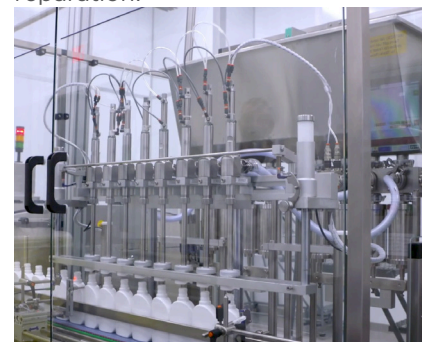
Ligne 10 Remplissage

« Dans ce cas spécial, les données de tendance enregistrées dans viewLinc ont indiqué une baisse de l'humidité. Dès que j'ai vu la tendance, j'ai contacté notre responsable de la maintenance. Il a vérifié la chambre et a déterminé que le chauffage de l'humidificateur était tombé en panne. Nous avons rapidement déplacé le produit dans une autre chambre jusqu'à ce que la maintenance puisse effectuer la réparation. »