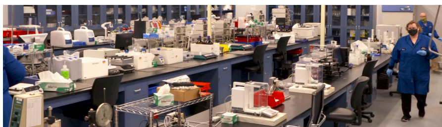
Laboratoire de contrôle qualité

« Notre portefeuille propose des produits de soin pour tous âges et tout type de peau, de la petite enfance aux adultes plus âgés. Un bon exemple est la gamme de produits solaires « Blue Lizard® ». Nous avons une formulation pour bébé, une version pour enfants et une crème solaire pour le sport qui est hydrofuge, » explique Mary Gilbert. « Les produits sont très variés. Nous avons par exemple un dispositif à micro-aiguilles, SkinPen® Precision. » Ce produit, dont l'efficacité est cliniquement prouvée, a été le premier appareil ayant reçu une approbation par la FDA pour améliorer les rides du cou et les cicatrices laissées par l'acné du visage.