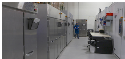
Chambres de stabilité